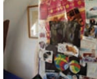
fra installationen: "Hjemme hos mor/ hjemme hos far"

Helle og Kristoffer taler sammen om Pernilles udvikling og trivsel. Deres gode samarbejde betyder, at Pernille ikke behøver opføre sig forskelligt, når hun skifter fra den ene til den anden. Forældrene snakker sammen om, hvad Pernille må og ikke må, så regler og pligter er ikke langt fra hinanden i de to hjem. Begge forældre er interesserede i, hvad Pernille går og laver – også når hun har været hos den anden. Pernille behøver ikke bekymre sig om, om der er ting, hun ikke kan fortælle den ene forælder.