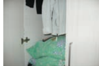
fra installationen: "Hjemme hos mor/ hjemme hos far"

Pigerne må ikke altid det samme. Det er nemlig bopælsforælderen, der bestemmer, om de kan tage på lejrskole med badmintonklubben eller holde fri fra skole. Nogle gange siger Esben, at Mia må noget, mens Dina ikke giver Katja lov.